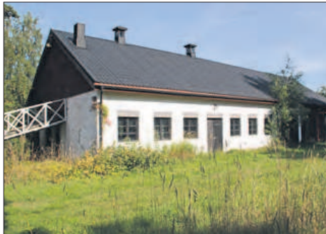
ALUEELLA on vielä vanhaa rakennuskantaa, mm. komea kivinavetta