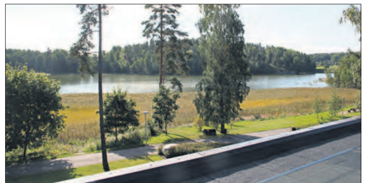
NÄKYMÄ Långvik Hotellista vastarannalla sijaitseville Långvik South Oyn maille.